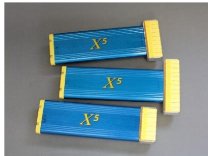
最適プロファイル設定条件検索機能付プロファイラ Profiler with Simulation Soft for Oven Recipe