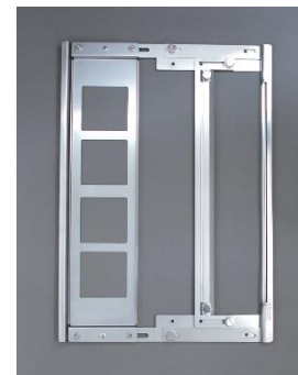
プロファイラー一体搬送型