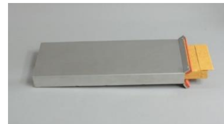
二重耐熱ケース構造 外装ケース装着時 : 耐熱 350°C