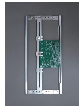
基板位置固定型 Fixed Position Type